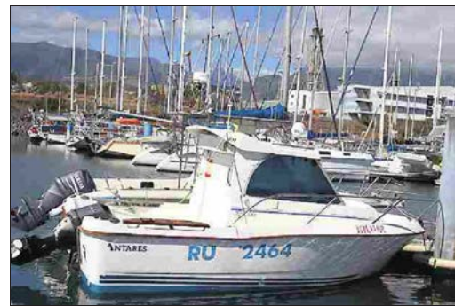
Les trois amis pêcheurs étaient sur le « Kilwa », bateau de Sudel Fuma, lorsqu'ils sont passés par dessus bord samedi soir.

nale a repéré un premier corps entre l'embouchure de l'Etang-Saint-Paul et le port de plaisance. Une heure plus tard, le deuxième était aussi repêché à 500 mètres au large.